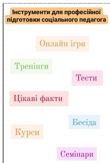
Рис. 1. Інструменти професійної підготовки майбутніх соціальних педагогів до соціально-педагогічного консультування в умовах дистанційної освіти

ігри; професійне тестування; участь в онлайн курсах професійного спрямування; круглі столи, семінари, інтерактивні бесіди з обговоренням цікавих фактів та міні-конференції; опанування сучасним ІКТ, розвиток медіа грамотності тощо (Рис. 1).