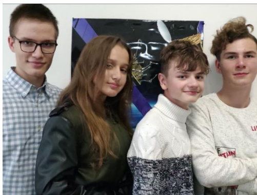
Рис.1 Команда MARSIK1

Серед учасників два роки поспіль є команда MARSIK1 – студенти коледжу спеціальності «Інженерія програмного забезпечення», які демонструють навички групової роботи, створюючи проєкт.