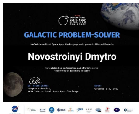
Рис.2 Сертифікат учасника хакатону

Під час безперервної роботи над проєктом учасники мають змогу поспілкуватися з менторами та поринути у неймовірну атмосферу форуму.